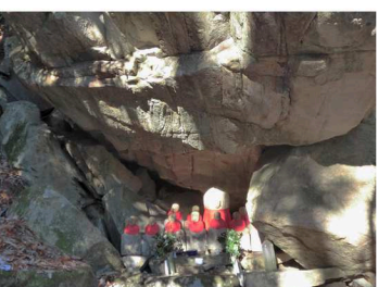
⑤かん千音岩札所 (41番~50番)