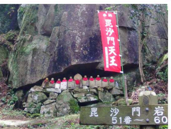
⑥毘沙門岩札所 (51番~60番)