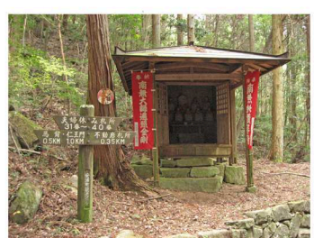
④夫婦休み札所 (31番~40番)